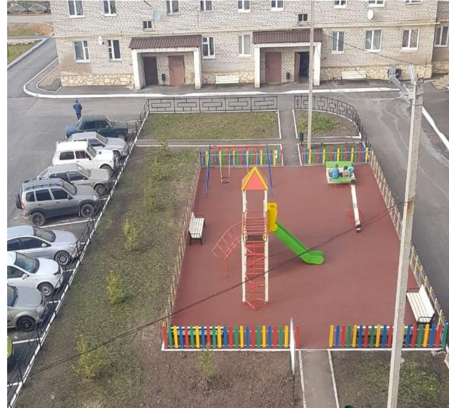
Благоустройство по программе «Башкирские дворики»